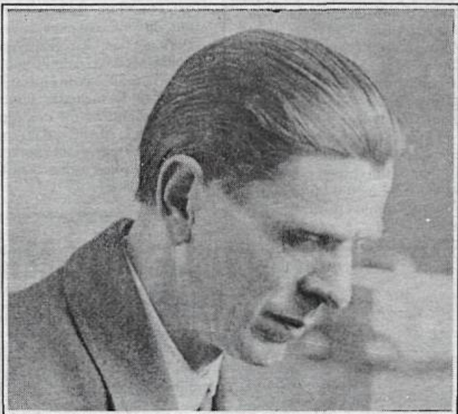
Stórmeistarinn, Geza Maroczy fæddist árið 1869 og lést 1951. Hann teflir nú við Kortsnoj að handan. Fullyrt er að þetta sé fyrsta „handanheimsskákinn“.